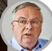
JEAN-FRANÇOIS RIME UDC, 68 ans, Gruyère. Elu au Conseil national en 2003.