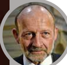
DOMINIQUE DE BUMAN PDC, 62 ans, Fribourg Ville. Elu en 2003 (Il achève son dernier mandat).