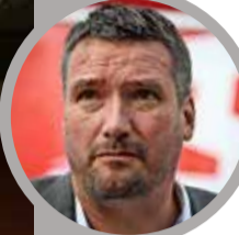
CHRISTIAN LEVRAT PS, 48 ans, Gruyère. Elu au Conseil national en 2003, puis au Conseil des Etats en 2012.