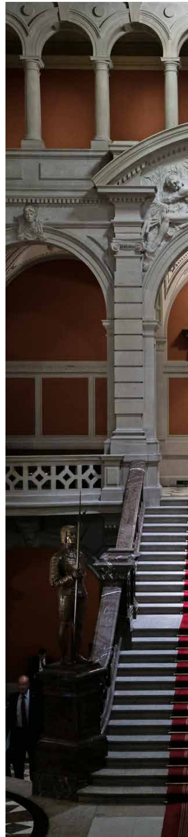
Beaucoup aimeraient gravir dans une année les marches qui