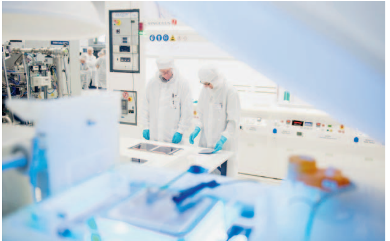
Le crédit de 26 milliards alloué à la formation, à la recherche et à l'innovation est bien trop faible aux yeux de certains.