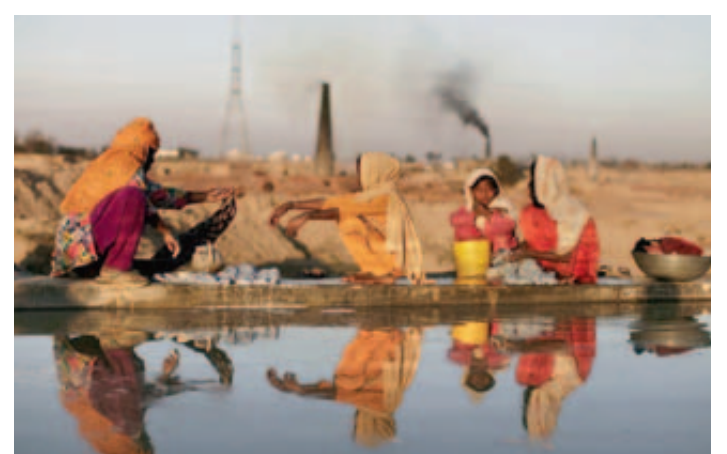
La loi votée au Pendjab fait office de première au Pakistan, pays conservateur et patriarcal.

Le Pendjab compte environ cent millions d'habitants, soit la moitié de la population totale du pays. Les atteintes aux droits des femmes, y compris des meurtres sous couvert «d'honneur» ou des attaques à l'acide restent fréquentes au Pakistan, pays de culture patriarcale et conservatrice, en dépit de décennies de lutte pour davantage d'égalité. ATS