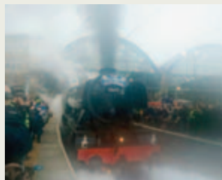
Foule à l'inauguration.

Un nombre grandissant de visiteurs se rendant dans le Colorado, premier Etat américain à avoir légalisé la vente du cannabis en 2014, se retrouvent aux urgences après en avoir trop consommé. L'ingestion de la drogue sous forme de comestible, dans des biscuits par exemple, est en cause. Le nombre de voyageurs dans l'Etat du Colorado qui se sont retrouvés aux urgences pour cette raison a augmenté de 109% entre 2012 et 2014. ATS